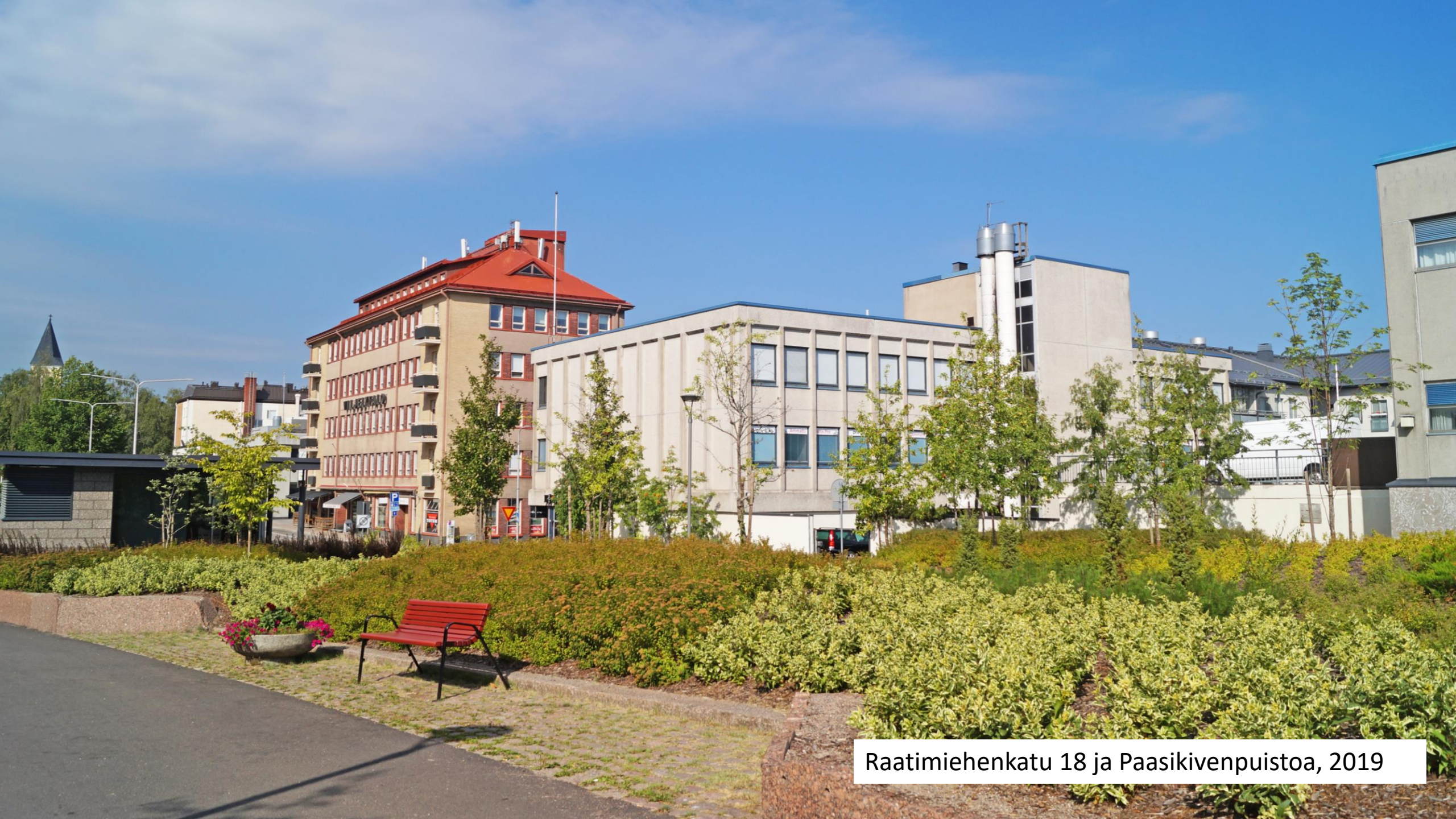
Raatimiehenkatu 18 ja Paasikivenpuistoa, 2019